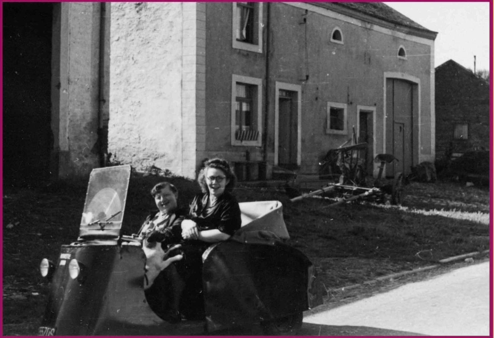
Et maintenant une "voiturette Morette" roule ma poule au revoir les amis